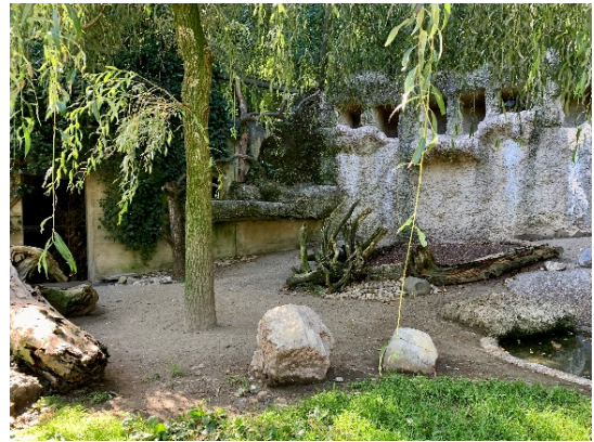
Standort Nummer: 15