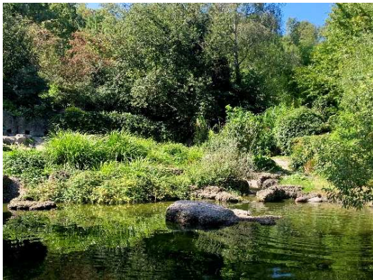
Standort Nummer: 11