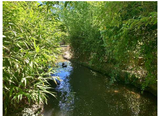
Standort Nummer: 4