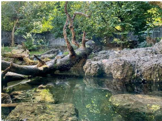
Standort Nummer: 13