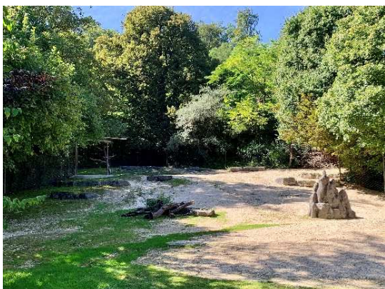
Standort Nummer: 5