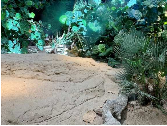
Standort Nummer: 1