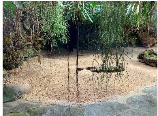
Standort Nummer: 14