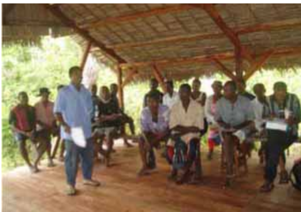
Die beachtlichen Ergebnisse wurden im Rahmen der drei Workshops vorgestellt.

Wie jedes Jahr, zählte es zu den Zielen dieser Workshops, über die Umweltaktivitäten im Jahre 2005 zu berichten und zwischen der ANGAP, dem WCS und den Küstengemeinden des Parks über die Verwaltung der Marinenparks Erfahrungen auszutauschen und andere beteiligte Parteien, so z.B. die lokalen Behörden, miteinzubeziehen.