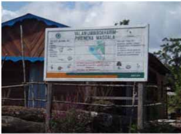
Informationstafel in Marofototra

Zu den weiteren Zielen zählten die Information und das Einbeziehen der lokalen Behörden in die Aktivitäten im Park. Zudem durfte die lokale Bevölkerung jeweils den Ort für das Anbringen der Informationstafel im Dorf (sehr zentraler Ort) mitbestimmen.