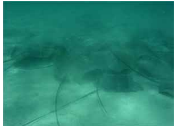
Etwa 50 Rochen konnten während diesem Zeitraum beobachtet werden.

Was die schädlichen Wirbellosen betrifft, so hat man eine beachtliche Anzahl Seeigel in den durch die Klimaunfälle am schlimmsten geschädigten Regionen festgestellt.