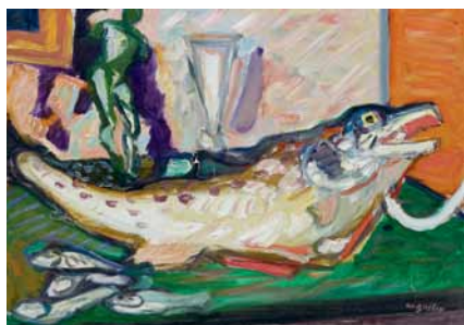
Max Gubler, Stillleben mit Fisch, 1947.