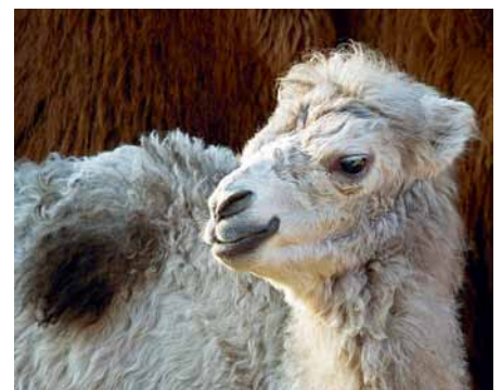
Liu-Shu ist das 29. Fohlen im Zoo Zürich.