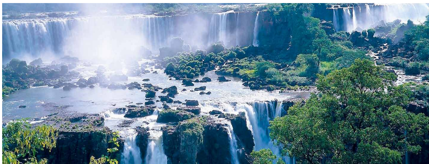
Die Zooreise geht entlang vielen Gewässern, auch zu den Iguazú-Wasserfällen.