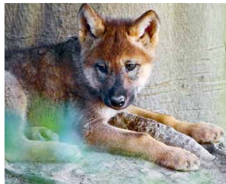
Noch neu im Rudel.