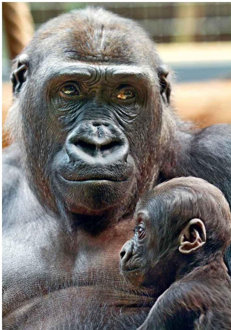
Erstes Mutterglück: N'Yokumi und Libonza.

sich N'Yokumi auch schon mal Libonza nach Gorillaart auf den Rücken. Ab und zu legt sie Libonza sorgsam neben sich auf den Boden und betrachtet sie intensiv. Sie entfernt sich nie weit von ihr, hat stets ein wachsames Auge auf sie und beim kleinsten Mucks ist sie sogleich zur Stelle.