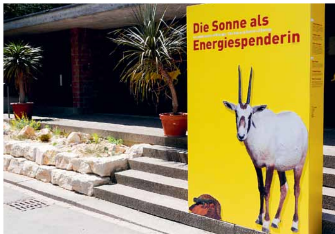
Die Oryx-Antilope wirbt für Solarenergie.

Neben der Energie stehen die Lebensräume und Verhaltensweisen der Tiere im Vordergrund. So geht es beim Fischotter nicht nur um die ökologisch ausgerichtete Erzeugung von Energie aus Wasserkraft. Auch die Ausrottung der Fischotter und die nötigen Massnahmen für seine Rückkehr in die Schweiz sind Thema der Ausstellung. Im Antilopenhaus, mit der an das starke Sonnenlicht der Wüste angepassten Oryx-Antilope, stehen die Sonne und die Solarkraftnutzung im Mittelpunkt. In einem Terrarium sind eigens für die Ausstellung Dornschwanzagamen eingezogen. Diese Reptilien sind ideal ans Wüstenklima angepasst und nutzen die Solarkraft auf perfekte Art und Weise.