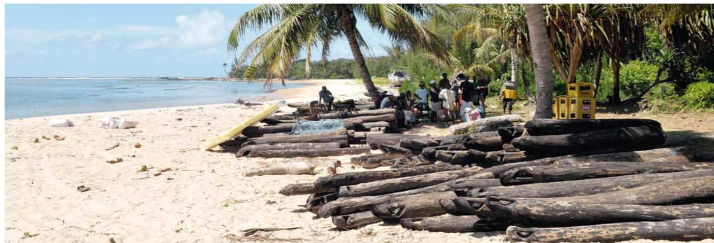
Illegal geschlagenes Rosenholz liegt am Strand bereit für den Weitertransport.

Im März 2009 wurde der demokratisch gewählte Präsident Madagaskars gestürzt und durch eine Übergangsregierung ersetzt. Seither werden die Wälder Madagaskars geplündert und geschützte Hölzer ungehindert exportiert.