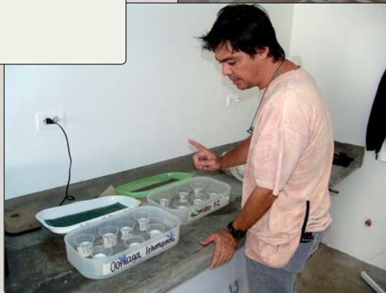
Regelmässig Zuchterfolge beim Dendrobates lehmanni